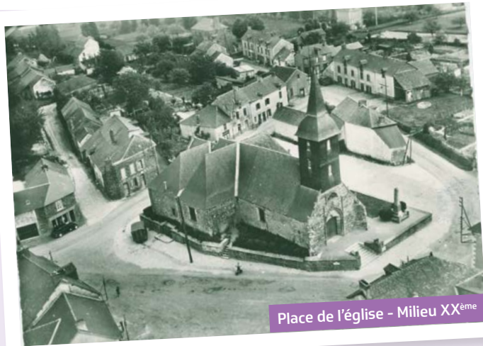
Place de l'église - Milieu XX ème

21 C'est le nombre de commerces qui existaient dans les années 1950 à 1980 dans un petit périmètre autour de la place de l'Église.