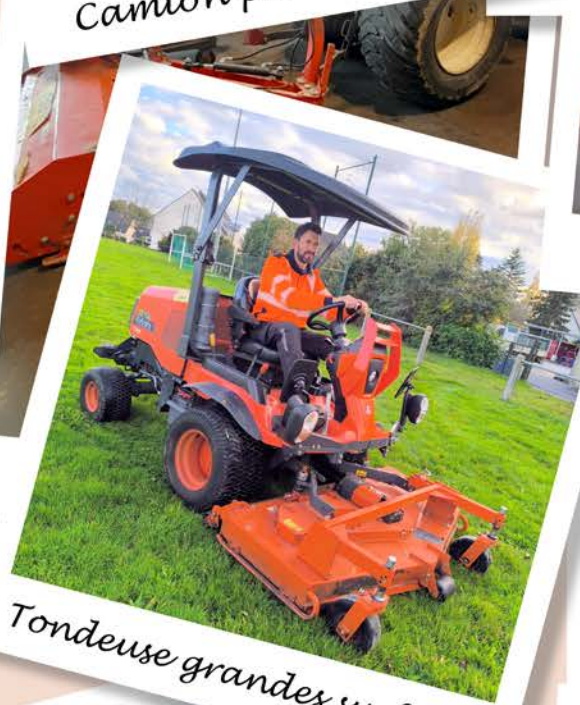
Tondeuse grandes surfaces