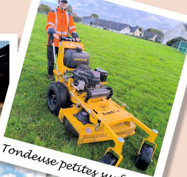
Tondeuse petites surfaces