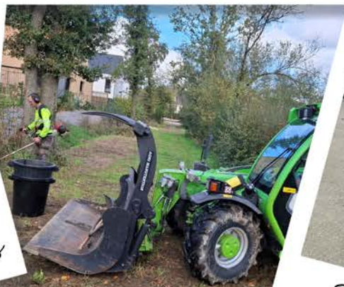
Entretien des espaces verts