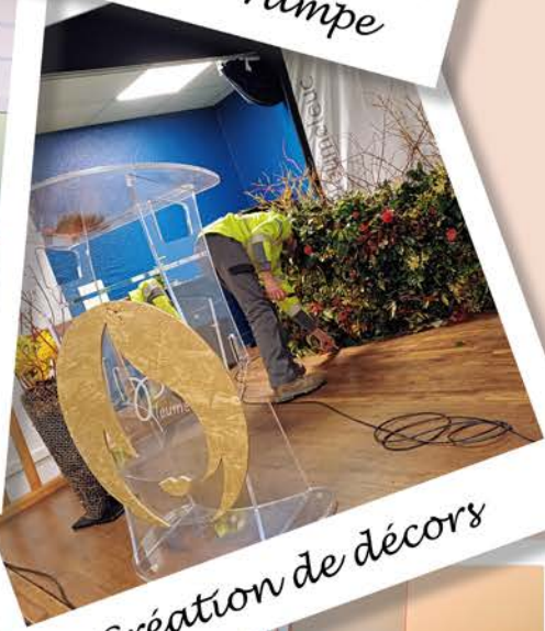
Création de décors