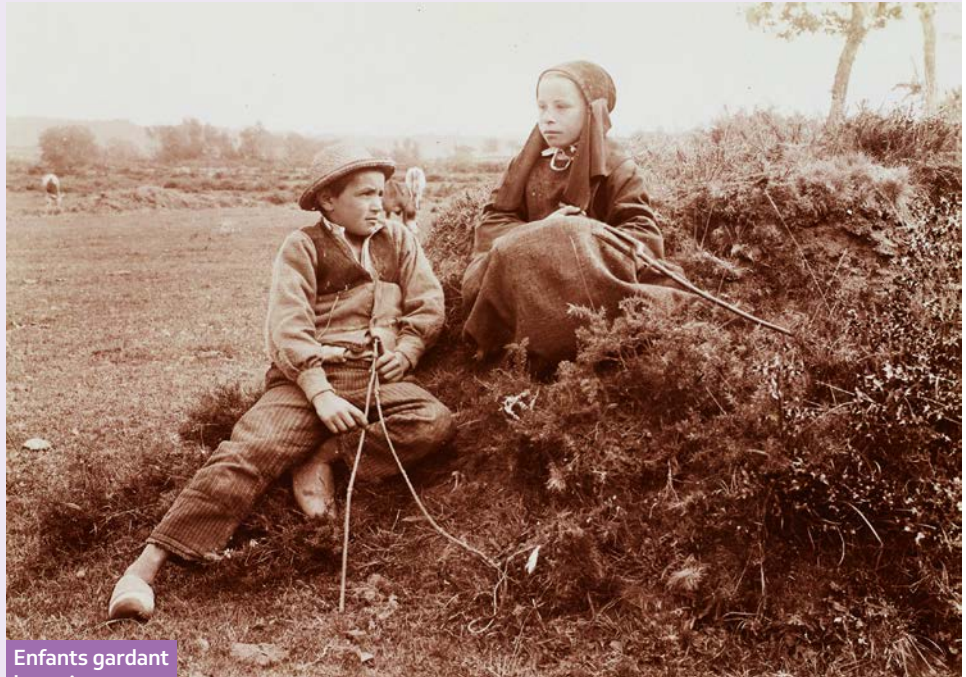
Enfants gardant les animaux