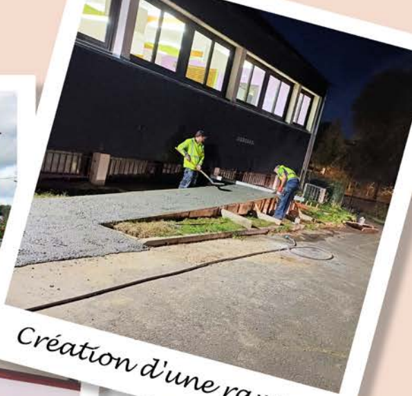
Création d'une rampe