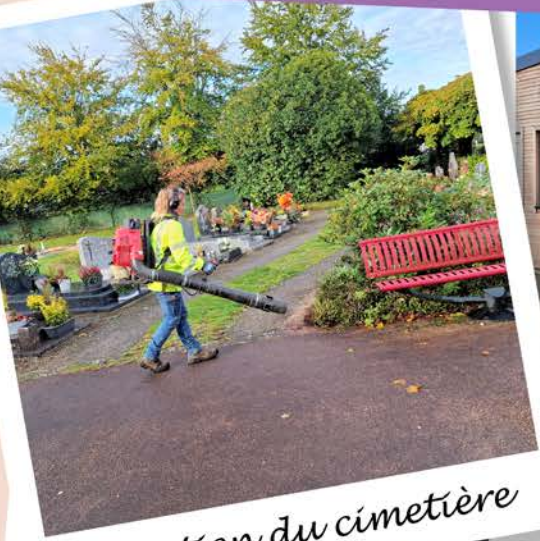
Entretien du cimetière