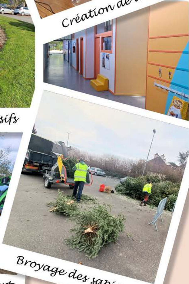
Broyage des sapins