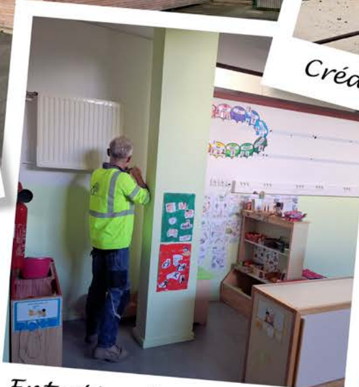
Entretien des bâtiments