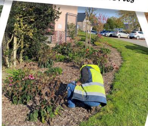
Création de massifs