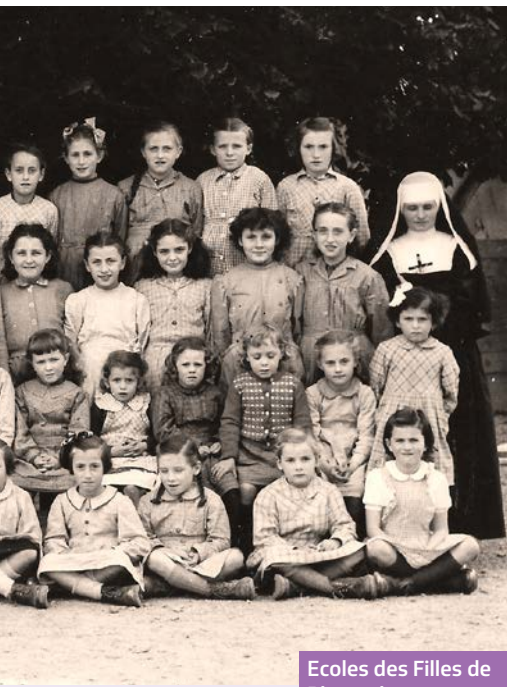
Ecoles des Filles de Pleumeleuc en 1953