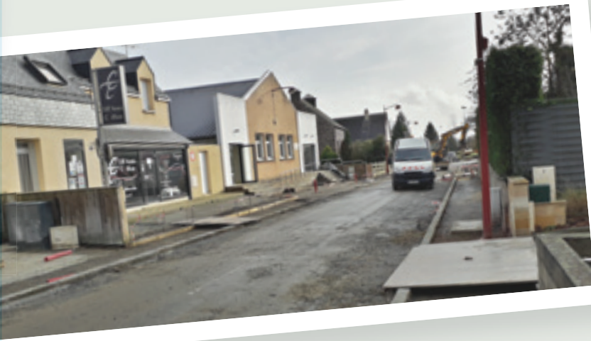
Travaux 2018 de la rue de Rennes.