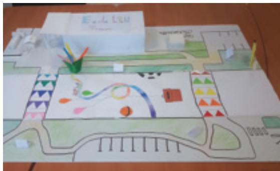
Maquette réalisée par le CMJ.