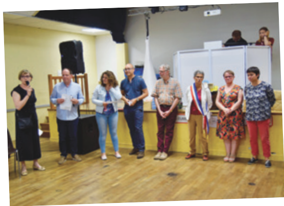
Discours officiel lors de la visite des Gallois le 1 er juin 2018.