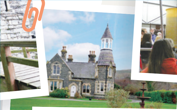
Visite de la cidrerie, suivie de la ville de Monfort.