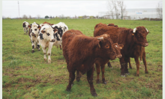
Vaches Salers et boeufs normands sur la prairie de Lauzenais.