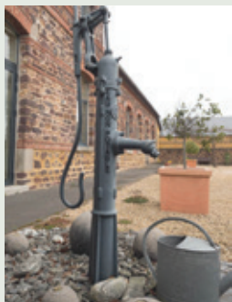
Pompe à eau à la médiathèque (petit patrimoine entretenu par le service technique).

Sur Pleumeleuc, la collecte des déchets ménagers et assimilés est gérée par le SMICTOM et celle des déchets urbains issus des espaces publics par la commune. ●