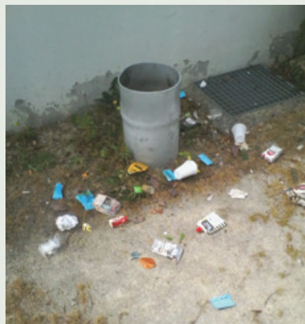
Ordures à côté d'une poubelle au groupe scolaire Le Petit Prince.

Retrouvez les informations sur vos déchets sur le site du SMICTOM : www.smictom-centreouest35.fr/que-deviennent-vos-dechets