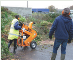
Mise à disposition du broyeur communautaire.

Par exemple, depuis l'installation, en 2015, du composteur au restaurant scolaire, 10 à 15 kg de déchets par jour sont ainsi valorisés, le gaspillage limité... et les enfants sont sensibilisés et formés aux gestes éco-citoyens.