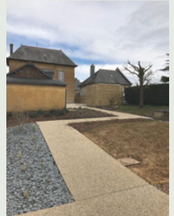
1, rue de Rennes dernier aménagement réalisé par les agents aux espaces verts.

Ce changement de pratiques implique aussi un changement de regard sur le degré de « propreté » : être plus tolérant et revoir sa perception des espaces verts. Il faut donc sensibiliser le public aux enjeux environnementaux, à ces pratiques plus naturelles de gestion et à ces nouvelles esthétiques de l'espace public.