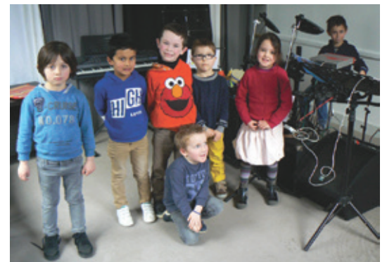
Jeunes musiciens en herbe de la section "Musique"

La section "Musique" animée par Arnaud Rabu, professeur de musique, s'adresse à un jeune public mais aussi à des adultes. Les instruments visés sont principalement la guitare (acoustique et électrique), le synthétiseur et la batterie. Cette section compte cinquante adhérents. Là aussi, un spectacle ouvert au public est offert par ces