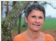
BIENVENUE DANS VOTRE NOUVEAU MAGAZINE !

Mais, toutes ces animations ne doivent leur pérennité qu'à l'investissement des bénévoles à qui j'adresse mes plus chaleureux remerciements et souhaite une bonne rentrée.