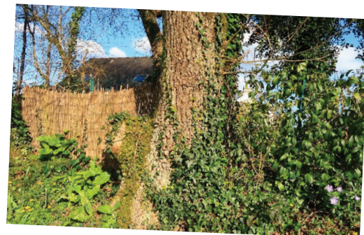
Clôture mixte : lierre, bignone persistante et palissade

De manière générale, il vaut mieux investir et passer du temps au départ sur un aménagement de qualité que de devoir y revenir tous les 2 à 3 ans... et générer beaucoup de déchets au passage.