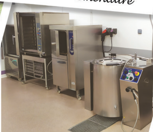
Les fours et la cuisson