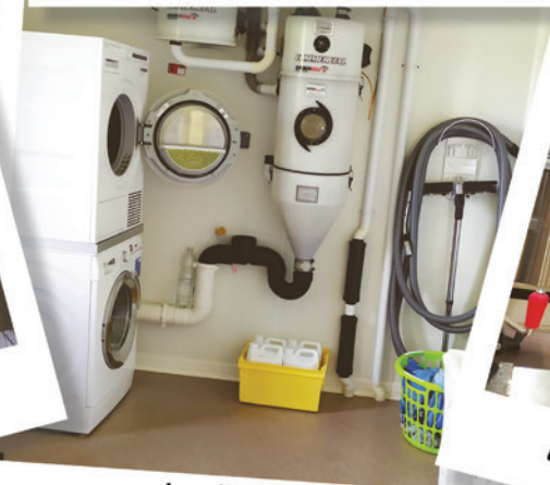
La lingerie (lavage des serviettes, torchons, blouses, ...)