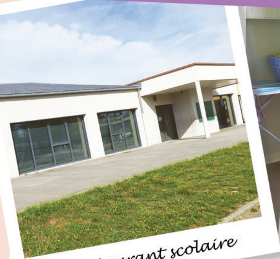
Le restaurant scolaire