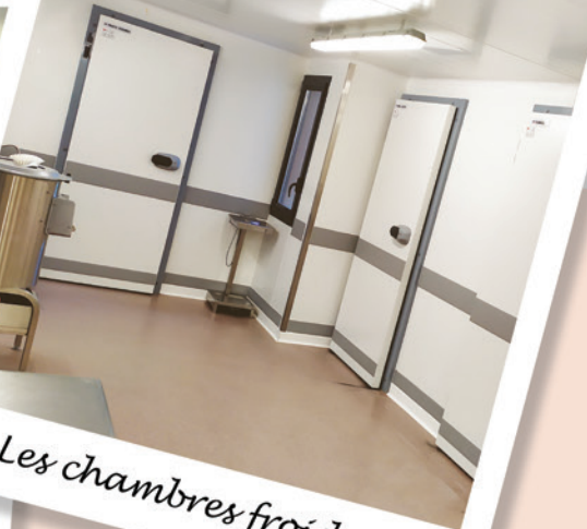
Les chambres froides